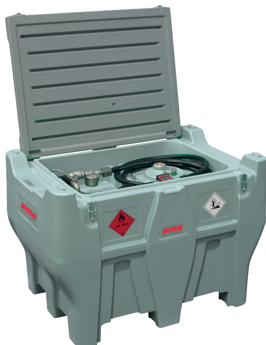
TT MOBILE DIESEL PICK-UP

FILTRO ASSORBIMENTO ACQUA , filtro a cartuccia con capacità filtrante 30 µm.